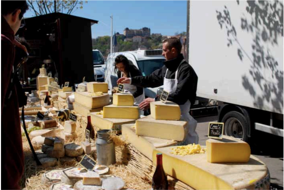
Abbildung 5: Käseauswahl am täglichen Markt an der Saône

Frankreich. Eine exzellente Möglichkeit zum Einkauf ausgezeichneter Lebensmittel sind die Regionalmärkte in Lyon. Die besten Angebote bekommt man bei Carrefour (im Centre Part Dieu), Casino aber auch dem zentral gelegenen Monoprix.