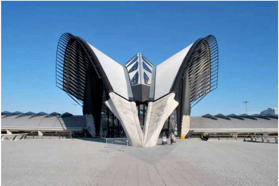
Abbildung 1: Der TGV-Bahnhof am Flughafen Lyon Saint-Exupéry

Die Anreise in das Nachbarland trat ich mit dem PKW an. Lyon ist durch sehr gut ausgebaute Autobahnen mit Deutschland verbunden, sodass ich mein Ziel in wenigen Stunden erreichen konnte. Lediglich Autobahn-Mautkosten mussten zu den Spritkosten addiert werden, die einen nicht unerheblichen Teil in Frankreich ausmachen (ca. 30 € ab Straßburg nach Lyon pro Strecke). Die Übergabe der Wohnung mit meiner Vermieterin lief problemlos und ich konnte mich gleich in mein neues Domizil einrichten.