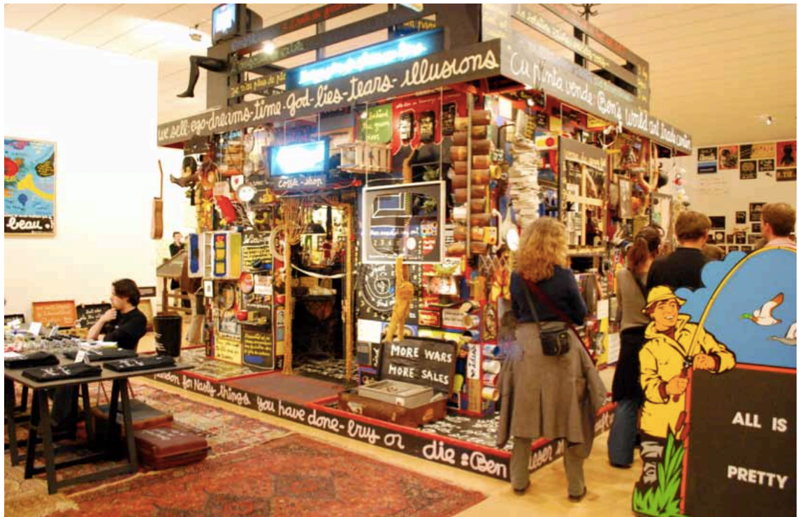
Abbildung 4: Das Musée D'Art Contemporain ist immer für eine Überraschung gut

Lyon ist eine Kulturmetropole und Hauptstadt der Gastronomie. Da die wichtigen Sehenswürdigkeiten jedem Reiseführer zu entnehmen sind, werde ich im Anhang in einem kleinen Exkurs meine Lieblingsrestaurants in Lyon vorstellen, die einen Besuch lohnen und einen ganz anderen Blick von Esskultur zulassen.