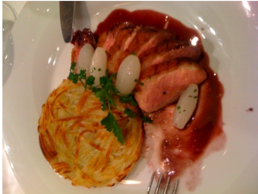
Abbildung 7: Le filet de Cannette de Vendée rôti, Pomme Paillasson, Navets glacés, jus à la lie de Vin rouge

Crème Fraîche mit geräuchertem Speck“ heißen könnte, besticht insbesondere durch die ausgezeichneten Austern.