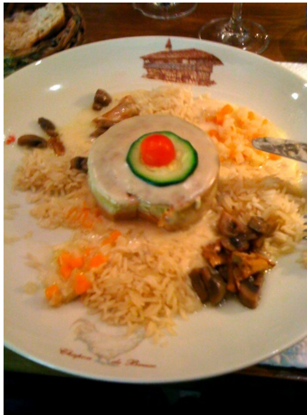
Abbildung 8: Gâteau de foies de volailles