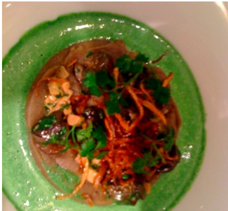
Abbildung 6: La fricassée d'Escargots au Foie gras de Canard, émulsion de Lentilles du Puy, jus de Persil plat et friture d'oignons

Gruß aus der Küche: Purée de pois cassés ist Erbsenpüree mit einem guten Schuss fruchtigen Vinaigrettes