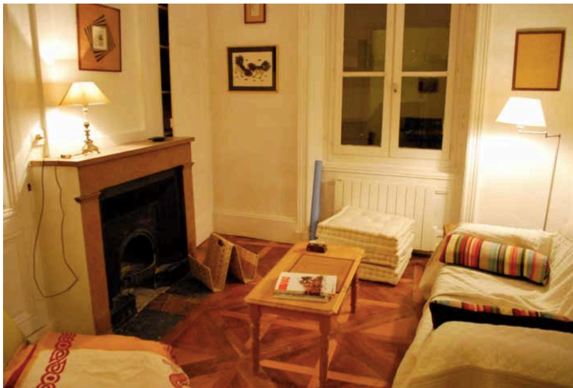
Abbildung 2: Mein Wohnzimmer mit Kamin

In Lyon wohnte ich im Herzen der Altstadt am Place Bellecour nur unweit von allen wichtigen Sehenswürdigkeiten der Stadt entfernt. Durch einen bekannten französischen Kommilitonen wurde mir die Wohnung vermittelt. Ich bewohnte eine 2-Zimmer Altbauwohnung mit etwa 60 qm zu einem angemessenen Preis (450 €). Die Wohnung war komplett möbliert und gut ausgestattet. Vor meinem Einzug war die Wohnung offenbar komplett renoviert worden, sodass die Ausstattung dementsprechend neuwertig und stilvoll war. Von meinem Fenster hatte ich einen ausgezeichneten Blick auf Notre Dame de Fourvière, welche, genau wie mein Wohnhaus, zum UNESCO-Weltkulturerbeensemble Lyons zählt. Zu den öffentlichen Verkehrsmitteln (Metrolinien, Bus und Straßenbahn) gelangte ich innerhalb von etwa 2 Minuten und hatte somit beste Voraussetzungen, mich in der Stadt zu bewegen.