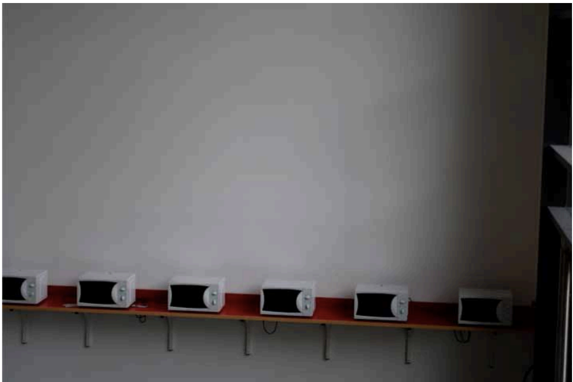
Abbildung 3: Die Bereitstellung von Mikrowellen ersetzt die Kantine

Die Schule ist eine Privatschule, für welche im Jahr etwa 3.000 € von den dort eingeschriebenen Studenten bezahlt werden muss. Dennoch ist die IDRAC keine Universität im klassischen Sinne, da BWL generell in Frankreich nur an Hochschulen (Ecole Supérieure) unterrichtet wird.